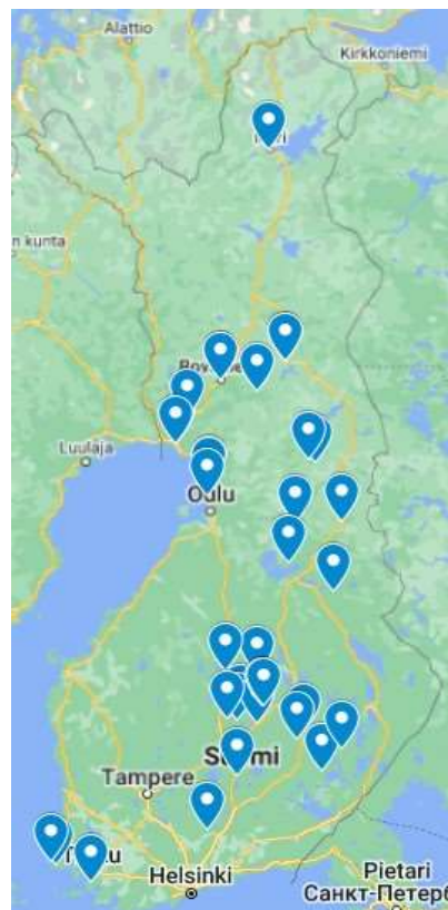
KUVA 1. MESTARI-KISÄLLI -TOIMINTAMALLIIN SITOUTUNEIDEN VESIVILJELYLAITOSTEN SIJAINNIT KARTALLA

Hankkeen oleellinen tavoite oli selvittää rahoitusmahdollisuuksia, tehdä hankesuunnitelma ja -hakemus sekä hakea rahoitusta tulevalle vesiviljelyn mestari- kisälli koulutus- ja rekrytointihankkeelle. Alueellisiin kalastuksen mestari-kisälli -hankkeisiin rahoitusta on tullut Euroopan meri-, kalatalous- ja vesiviljelyrahastosta (EMKVR), koska vesiviljelyn puolella hanke toteutetaan valtakunnallisesti, ei EMVVR-tuki