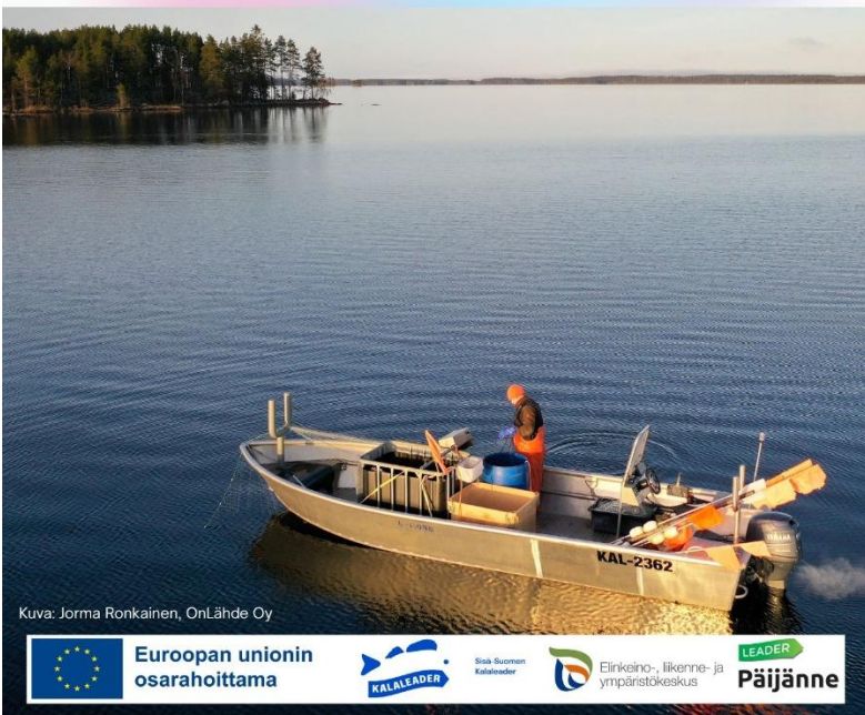
Kuva 8. Kestävää kalastusta yhteistyöllä - julkaisun kansi.

HYVIÄ KÄYTÄNTÖJÄ KAUPALLISILLE KALASTAJILLE JA VESIALUEENOMISTAJILLE