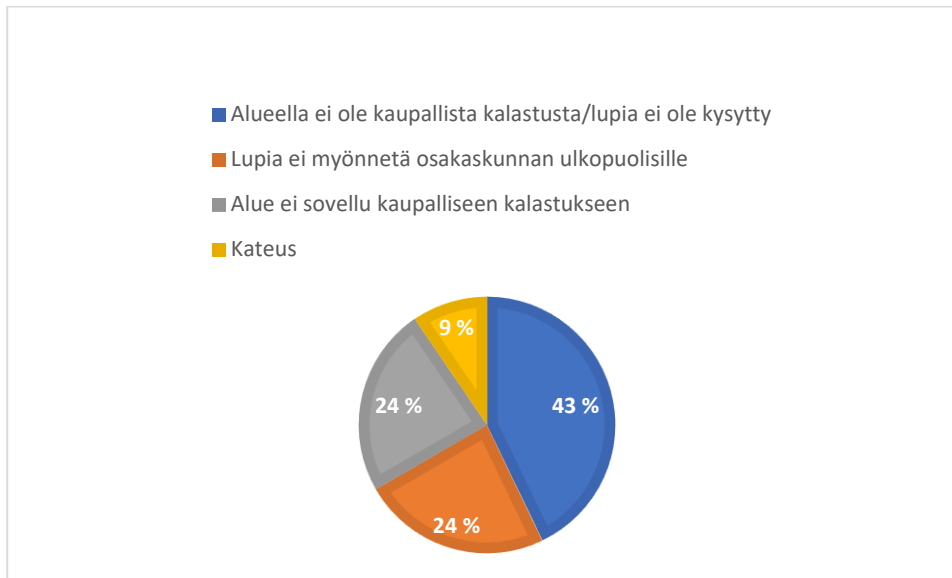
Taulukko 2. Syyt, joiden vuoksi kaupallisen kalastuksen lupia ei myönnetä (kysely vesialueenomistajille).

Yksi keskeinen havainto oli lupakäytäntöjen pirstaleisuus. Osakaskuntien toimintamallit, lupaehtojen määrittely ja päätöksenteon aikataulut poikkeavat toisistaan, eikä kalastajalla ole aina selkeää käsitystä siitä, keneltä lupaa haetaan tai millä perusteilla päätökset tehdään. Tämä korostuu erityisesti alueilla, joissa osakaskuntien toiminta on passiivista tai joissa päätöksenteko perustuu pitkälti vakiintuneisiin käytäntöihin.