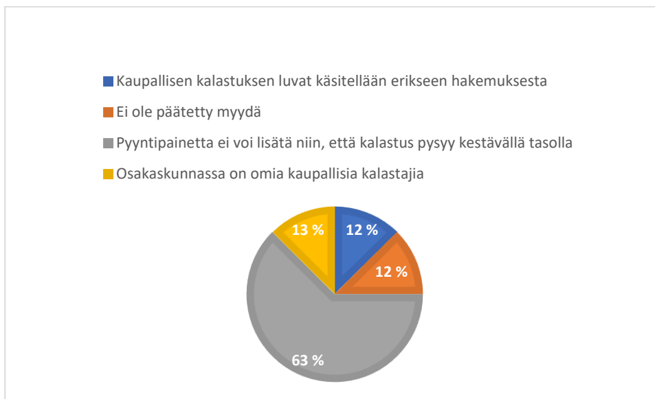
Taulukko 3. Syyt, joiden vuoksi kaupallisen kalastuksen lupia ei myönnetä vesialueilla (kysely vesialueenomistajille).

Kalastajille suunnatun kyselyn avoimet vastaukset täydensivät vesialueenomistajien näkemyksiä ja toivat esiin vesillepääsyn arjen haasteita kalastajan näkökulmasta. Vastauksissa korostui erityisesti lupaprosessien ennakoimattomuus: kalastajat kokivat, että lupien saaminen riippuu usein paikallisista käytännöistä, yksittäisten toimijoiden aktiivisuudesta sekä siitä, kuinka usein lupia käsitellään osakaskunnissa.