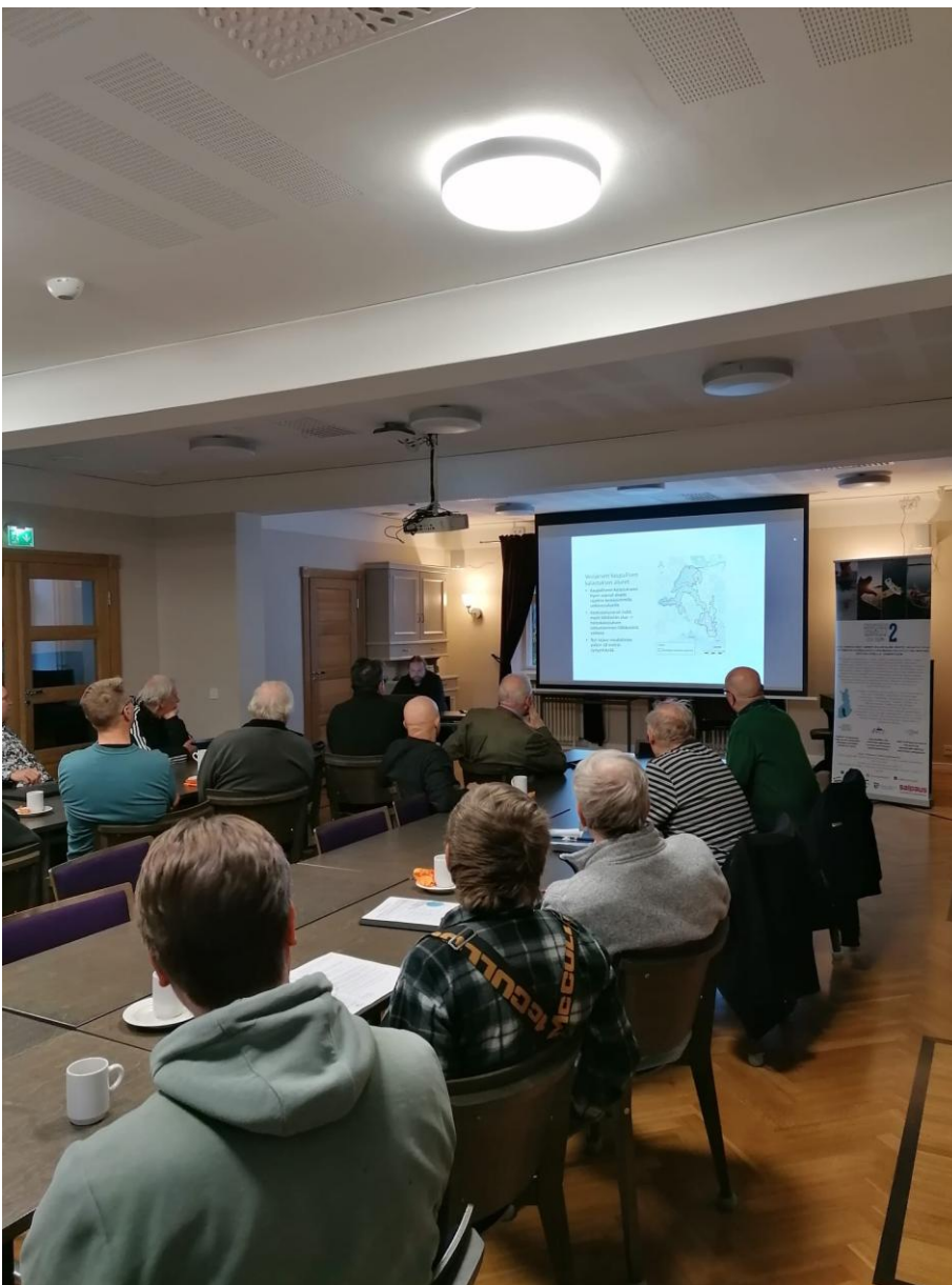
Kuva 5. Asikkalan tilaisuudessa oli mukana vesialueen omistajien lisäksi kalastajia.

Tilaisuuksista koottiin yhteenvedot, jotka julkaistiin Sisä-Suomen Kalaleaderin verkkosivuilla. Ne toimivat paitsi hankkeen dokumentaationa, myös työkaluna niille osakaskunnille ja kalastajille, jotka eivät pääseet tapahtumiin mukaan. Tämä aineisto täydentää hankkeen lopuksi valmistunutta julkaisua ja tarjoaa tietoa erityisesti niistä kysymyksistä, jotka keskusteluissa nousivat esiin toistuvasti.